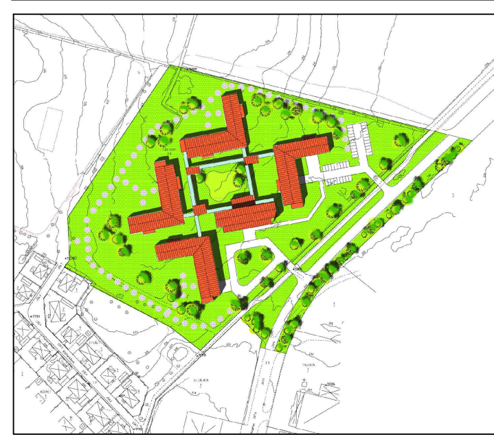
ILLUSTRATIONSKARTA Skala: 1:4000